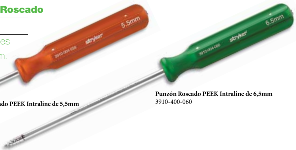
Punzón Roscado PEEK IntraLine de 6,5mm 3910-400-060