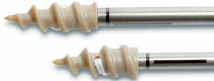
Anclaje PEEK IntraLine