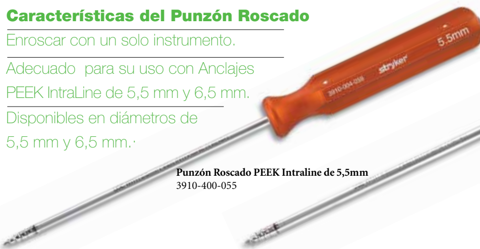
Punzón Roscado PEEK IntraLine de 5,5mm 3910-400-055

Disponibles en diámetros de 5,5 mm y 6,5 mm.